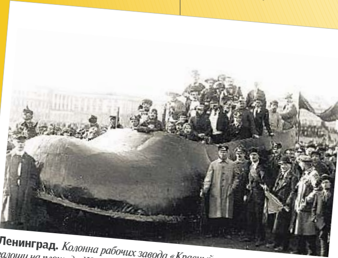
Ленинград. Колонна рабочих завода «Красный треугольник» с макетом салюта на площади Жертв Революции во время первомайской демонстрации