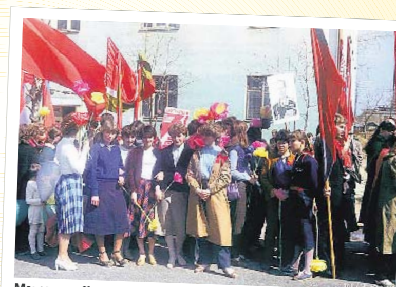
Молодежь. Кричали «Ура!» Брежневу и тайно слушали Высоцкого