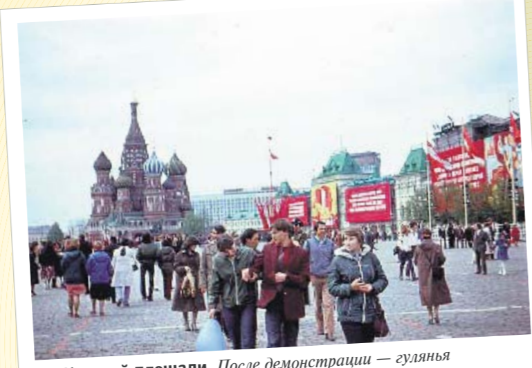
На Красной площади. После демонстрации — гулянья

Праздник ■ Традиции празднования дня трудящихся в нашей стране: от стычек с полицией до драк с националистами