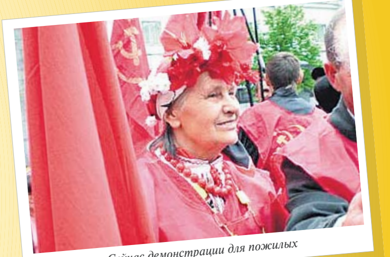
Старожилы. Сейчас демонстрации для пожилых