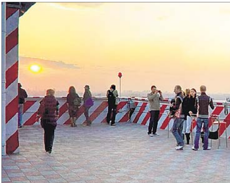
Красновоздний, 4. На крыше этого дома вам дадут бинокль и кофе

Самой престижной смотровой в Киеве считается площадка в Мариинском парке у Верховной Рады и самого Мариинского