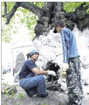
К липе Феодосия Печерского — за здоровьем

Если вы верите в чудеса и у вас есть сокровенные желания, навесите старика Грюнвальда. Самому старому дереву Киева почти 1000 лет! Это дуб, названный в честь средневекового немецкого художника Матиаса Грюнвальда, рисовавшего дубы. Дерево выглядит сказочно и необычно, как и картины этого автора. Местные жители молятся возле дуба: над дуплом в прошлом году проявился лик Богородицы. Говорят, все желания исполняются, если помолиться на дуб. Высота дуба — 20 м, обхват ствола — 7 м. Находится он на территории санатория «Жовтень» (Столичное шоссе).