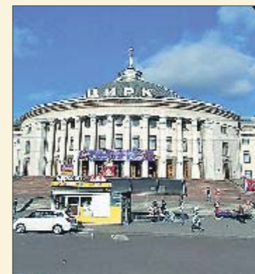
Центр. Недавно был окраиной

► До конца позапрошлого века на месте киевского цирка была окраина города: овраги, болотистые берега реки Лыбидь и ручей... Скоморох. Последний сейчас течет под землей, а происшествия, которые порой случаются в цирке, наводят на мысль, что Скоморох подшучивает над артистами. «Однажды дрессировщица должна была влететь на арену из зала, пролетев над зрителями. Но один из них схватил ее за ногу — думал, что падает. При-