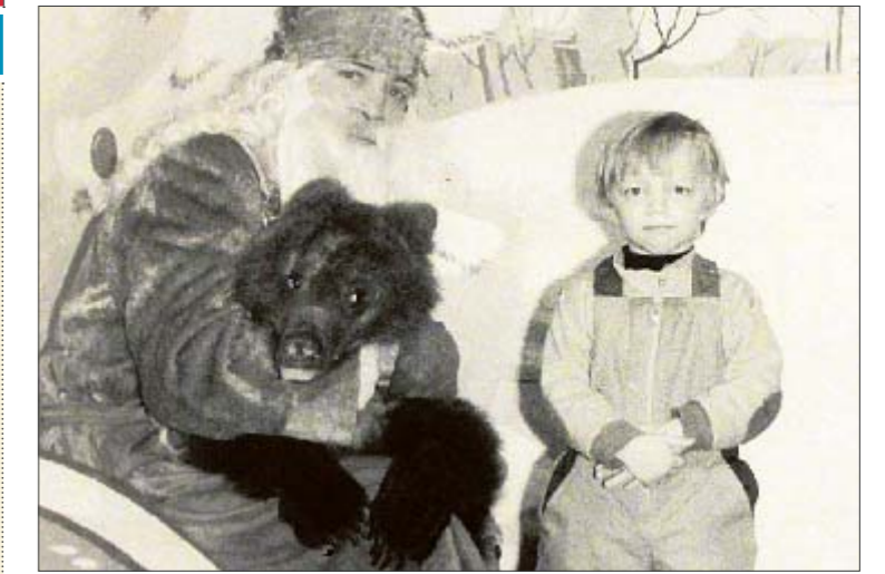
Юный «преступник». Один из беглецов с артистом и зрителем