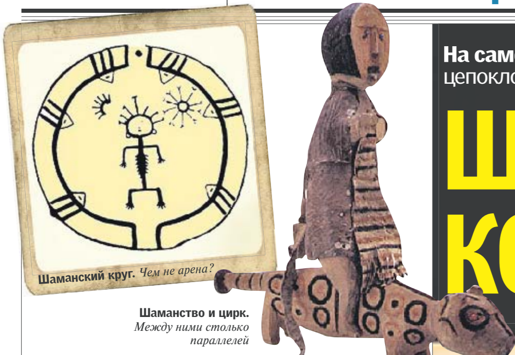
Шаманский круг. Чем не арена?

Шаманство и цирк. Между ними столько параллелей