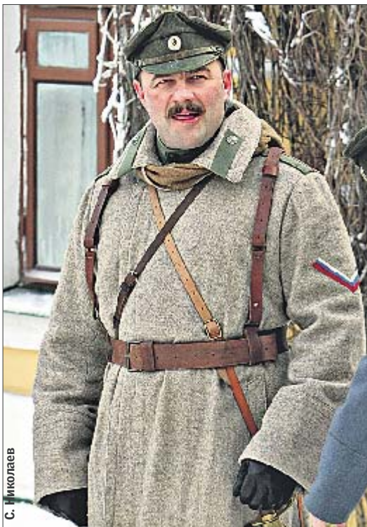
Пореченков. Форма на актере хорошо сидит