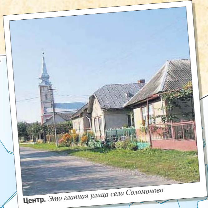
Центр. Это главная улица села Соломоново

еще дополнительных 3—5 тысяч гривен. Более рискованные зарабатывают, помогая провести за кордон нелегалов. Соломоново — интернациональное село. Кроме украинцев, в нем живет много венгров. Украинцы говорят на русинском диалекте (похож на старославянский язык). Вообще, люди поневоле стали полиглотами — кроме украинского, могут изъясняться на венгерском, русском, словацком. Ходят в разные храмы — украинский православный, протестантский, католический (в Чопе) и баптистский молитвенный дом. При этом все уживаются мирно и дружно.