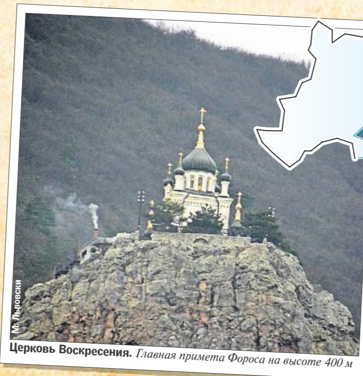
Церковь Воскресения. Главная примета Фороса на высоте 400 м

Находясь примерно на равном расстоянии от Ялты и Севастополя — 35—40 км, жители ездят туда на маршрутках (стоимость проезда — 12 грн.). За бытовой техникой и продуктами чаще ездят в Севастополь — там и супермаркетов больше, и парковаться легче. А за мясом — в Ялту. Там дешевле. Поселок по-настоящему оживает к лету, когда население увеличивается в 2—2,5 раза, и вся жизнь там «привязана» к курортному сезону. Несмотря на сравнительно скромные зарплаты в здравницах, где трудоустроена основная часть населения (от 800 до 2000 грн.), а летом — до 3,2 тыс. грн.), люди в Форосе не бедствуют. По словам секретаря поссовета Константина Волкова, как минимум у каждой третьей семьи есть автомобиль, почти все квартиры с кондиционе-