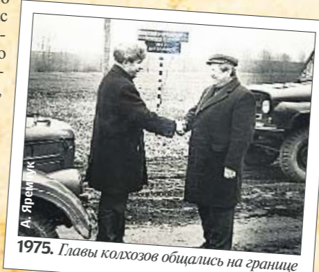
1975. Главы колхозов общались на границе