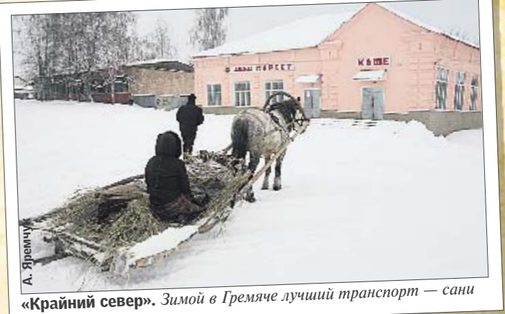
«Крайний север». Зимой в Гремье лучший транспорт — сани