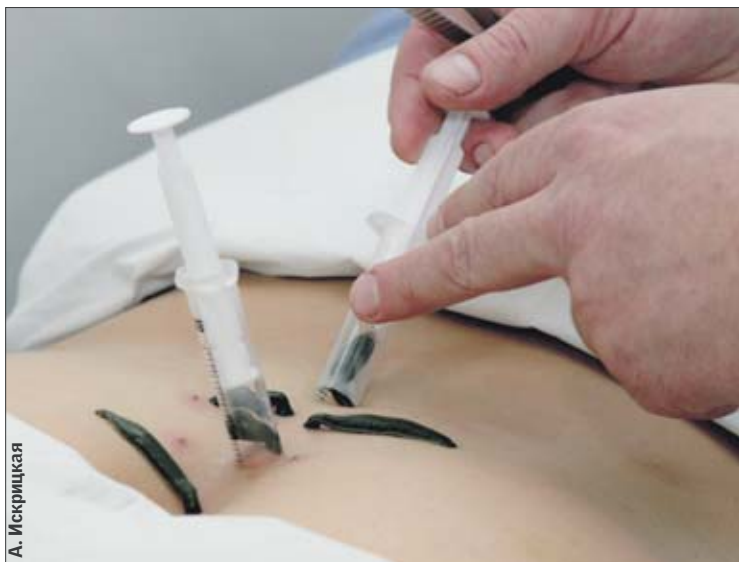
Кровососы. Одна пиявка высасывает около 15 мл крови

Перед первым сеансом врач обязан ознакомить вас с «лекарями» и их документами. Дело в том, что пиявок для лечения выращивают в искусственных условиях на биофабриках под тщательным контролем биологов. Каждая партия пиявок должна иметь специальный сертификат соответствия, где указаны все их особенности (длина, вес, проверка на различные болезни). Вряд ли домашние шарлатаны имеют соответствующие документы, ведь для этого у них должен быть заключен контракт с биофабрикой на поставку пиявок. Если вы все же решились воспользоваться такими услугами, купите пиявок сами в аптеке — так вы будете уверены в их «одноразовости».