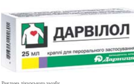
Рекомендуемая лекарственная форма. Фармацевтическая фирма «Дарница» Укр. пат. 02093, м.Біла Лука, Борщівський р-н, 13. Тел: +38 (044) 207-73-00 Р.П. УА/1891/01/01 від 17.09.2004

уменьшению сердцебиения, улучшает работу сердца. И помните, только спокойному и уверенному в себе человеку под силу достойно преодолеть все житейские неурядицы и обрести настоящее счастье!